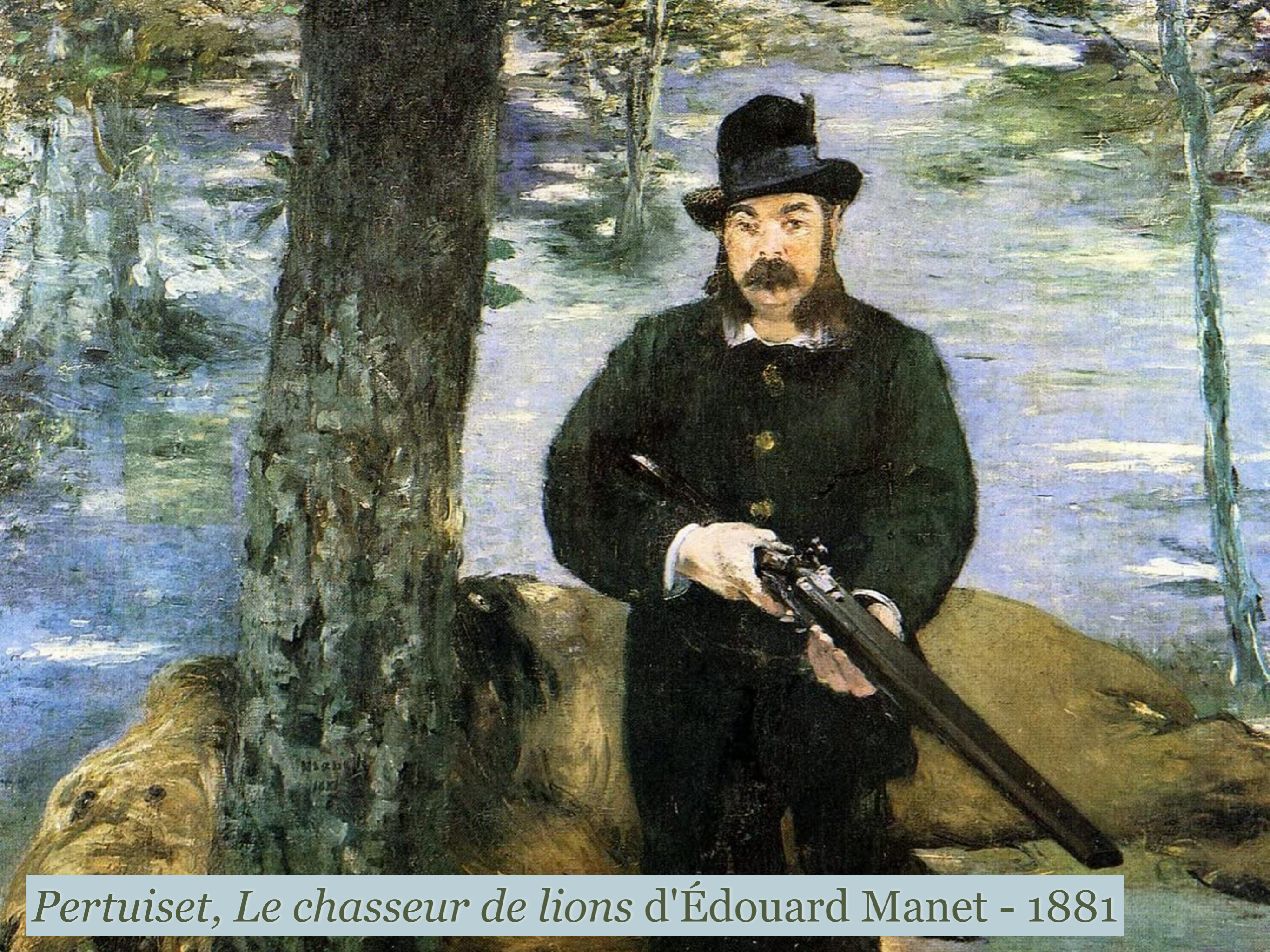
Pertuiset, Le chasseur de lions d'Édouard Manet - 1881