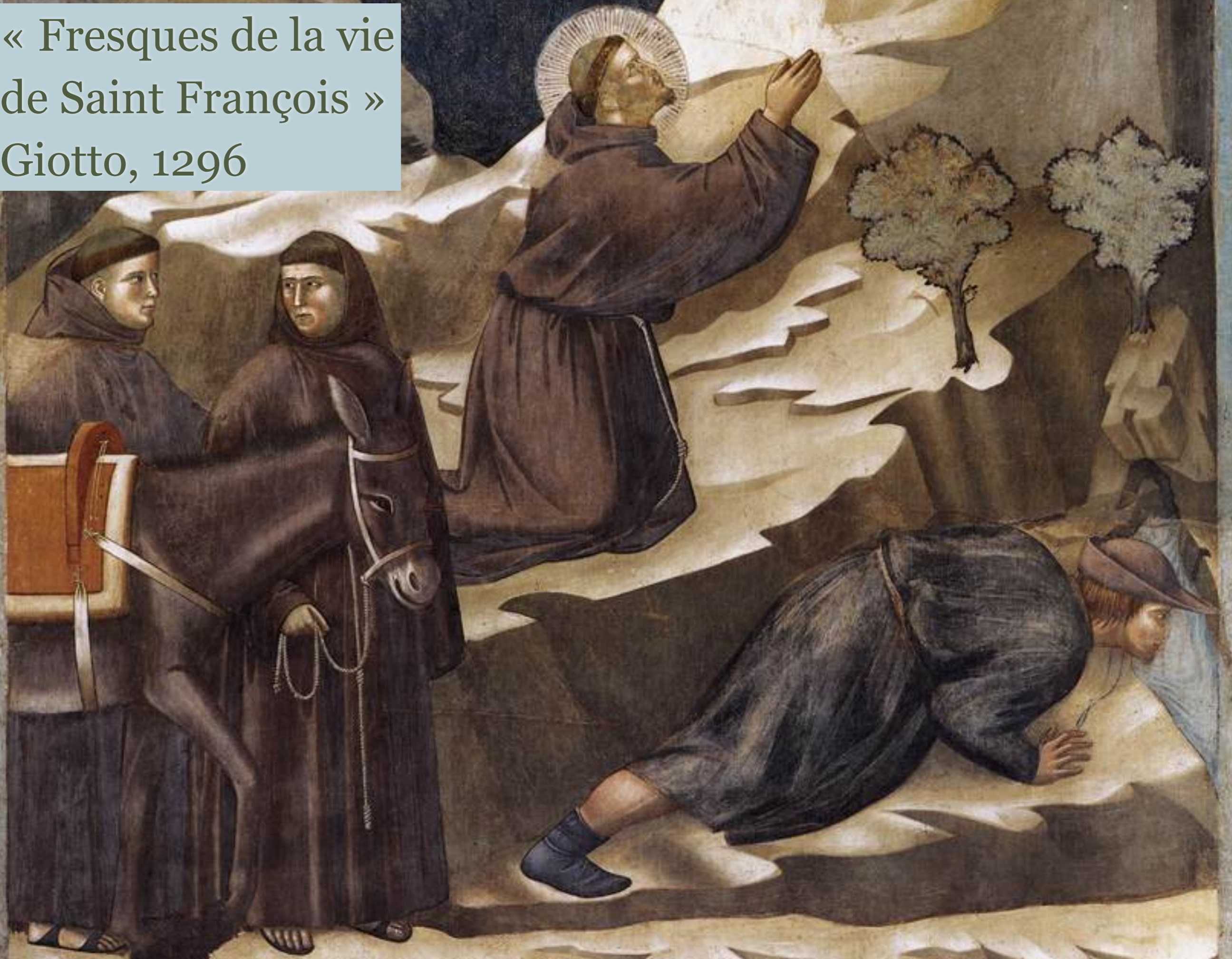
« Fresques de la vie de Saint François » Giotto, 1296