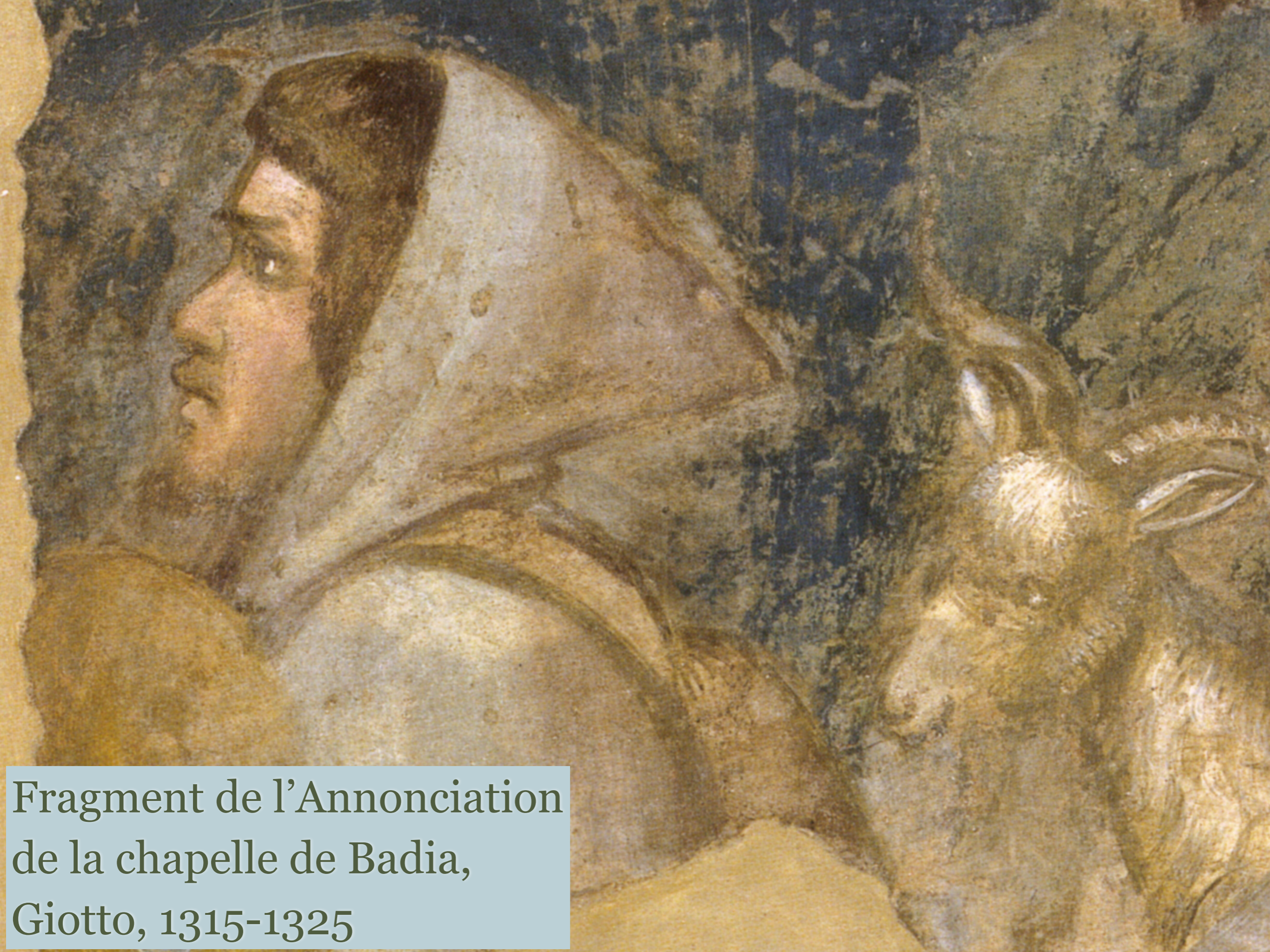
Fragment de l'Annonciation de la chapelle de Badia, Giotto, 1315-1325