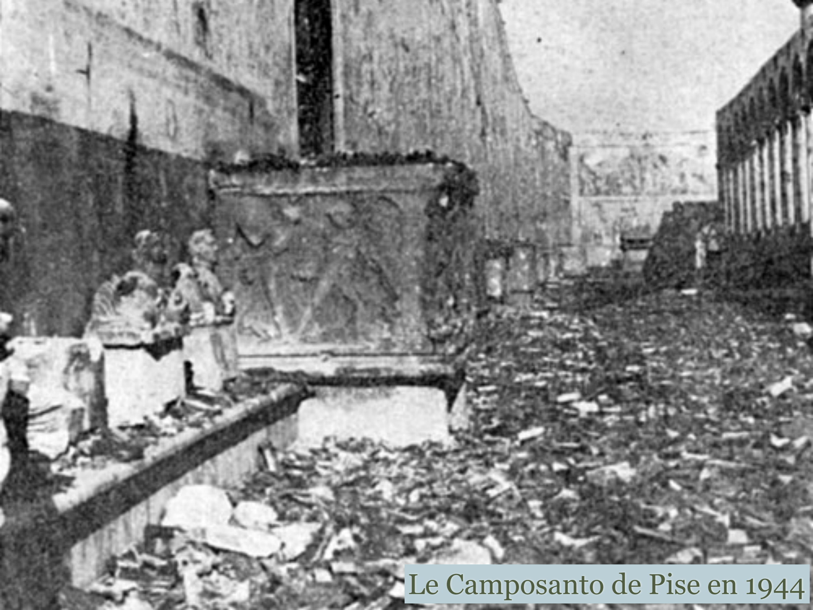
Le Camposanto de Pise en 1944