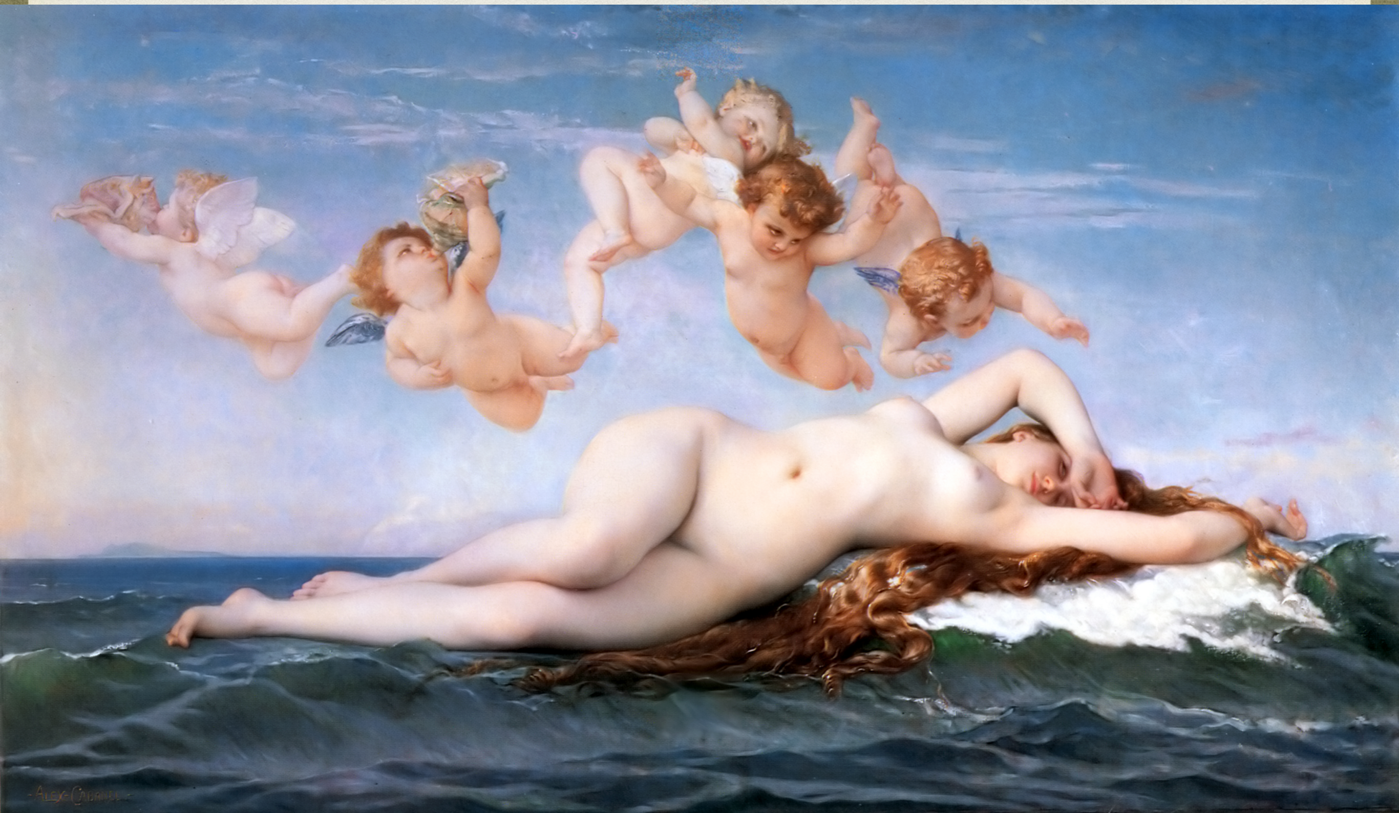
La Naissance de Vénus - 1863