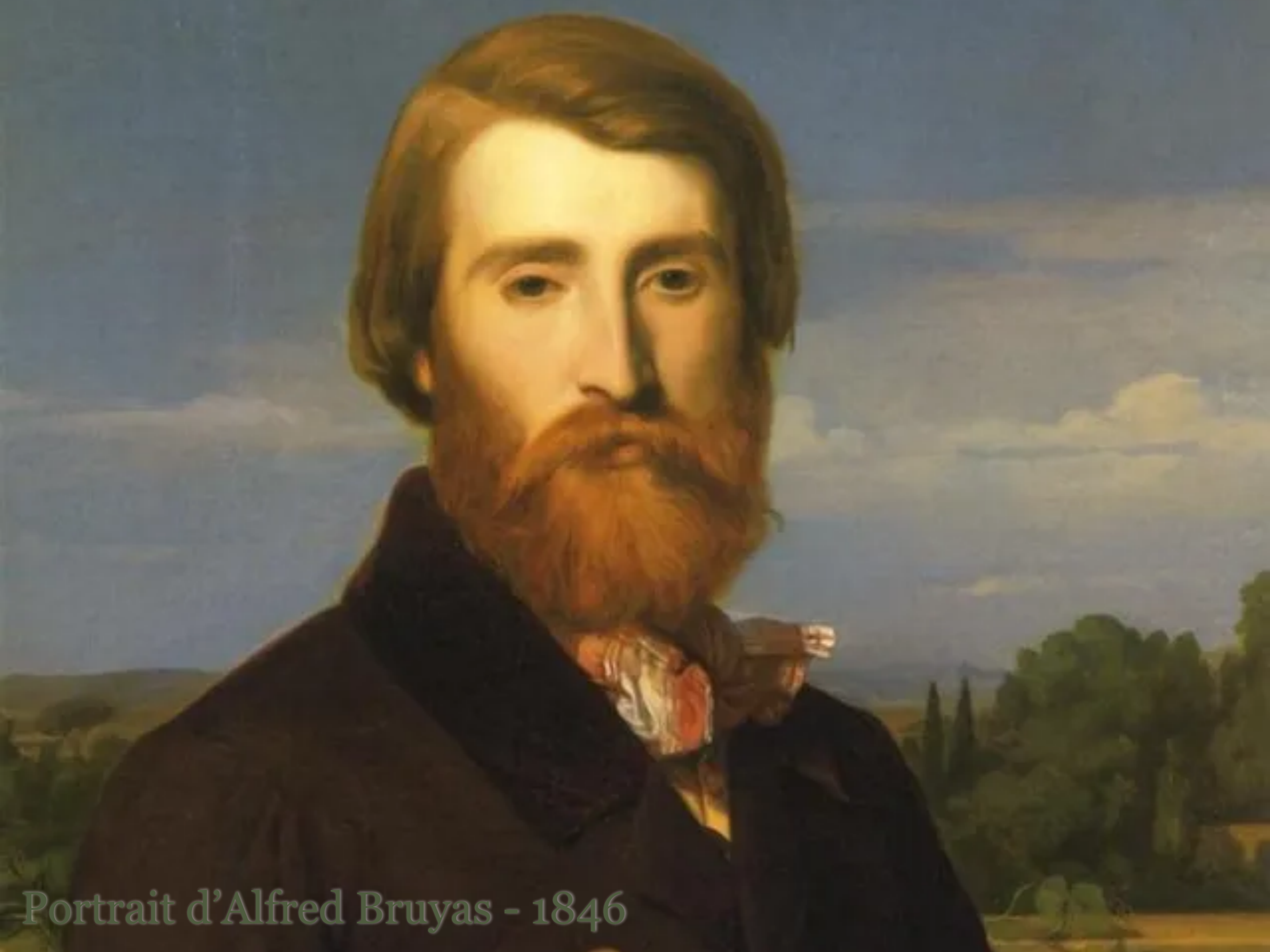
Portrait d'Alfred Bruyas - 1846