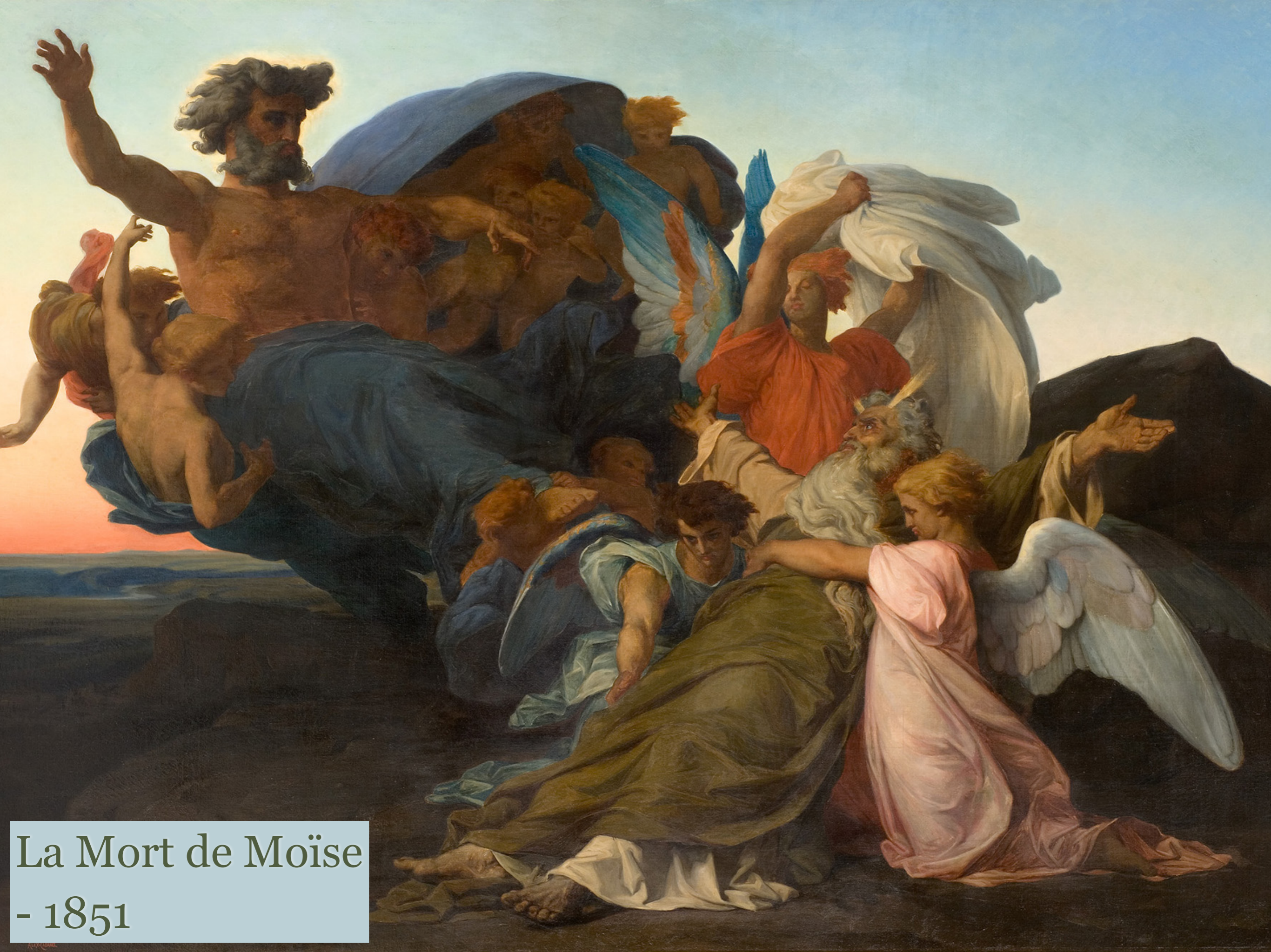
La Mort de Moïse - 1851