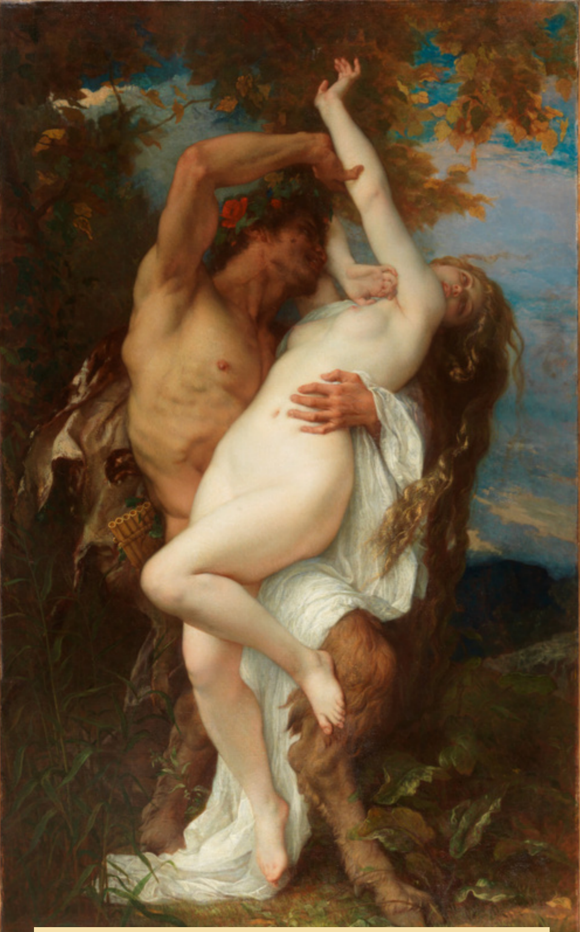
Nymphe et satyre - 1860