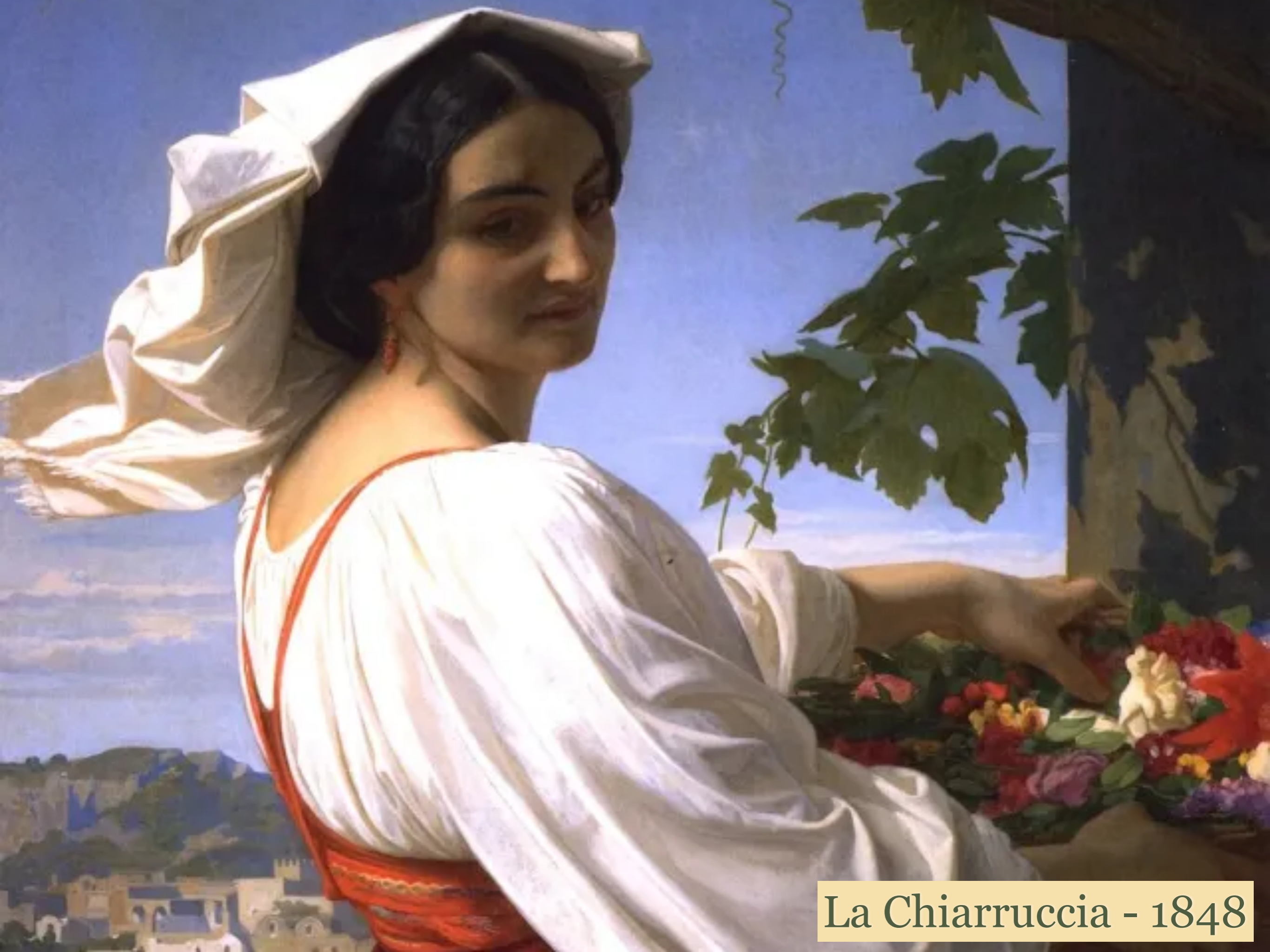
La Chiarruccia - 1848