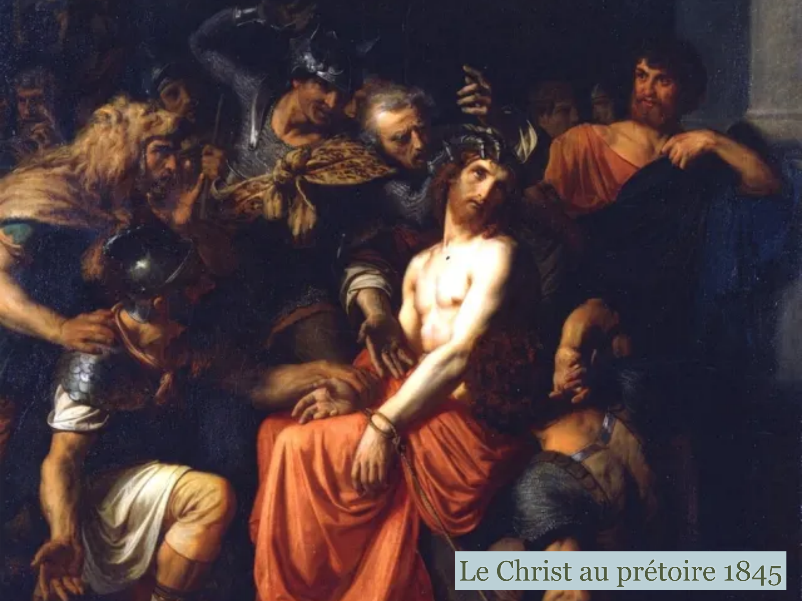
Le Christ au prétoire 1845