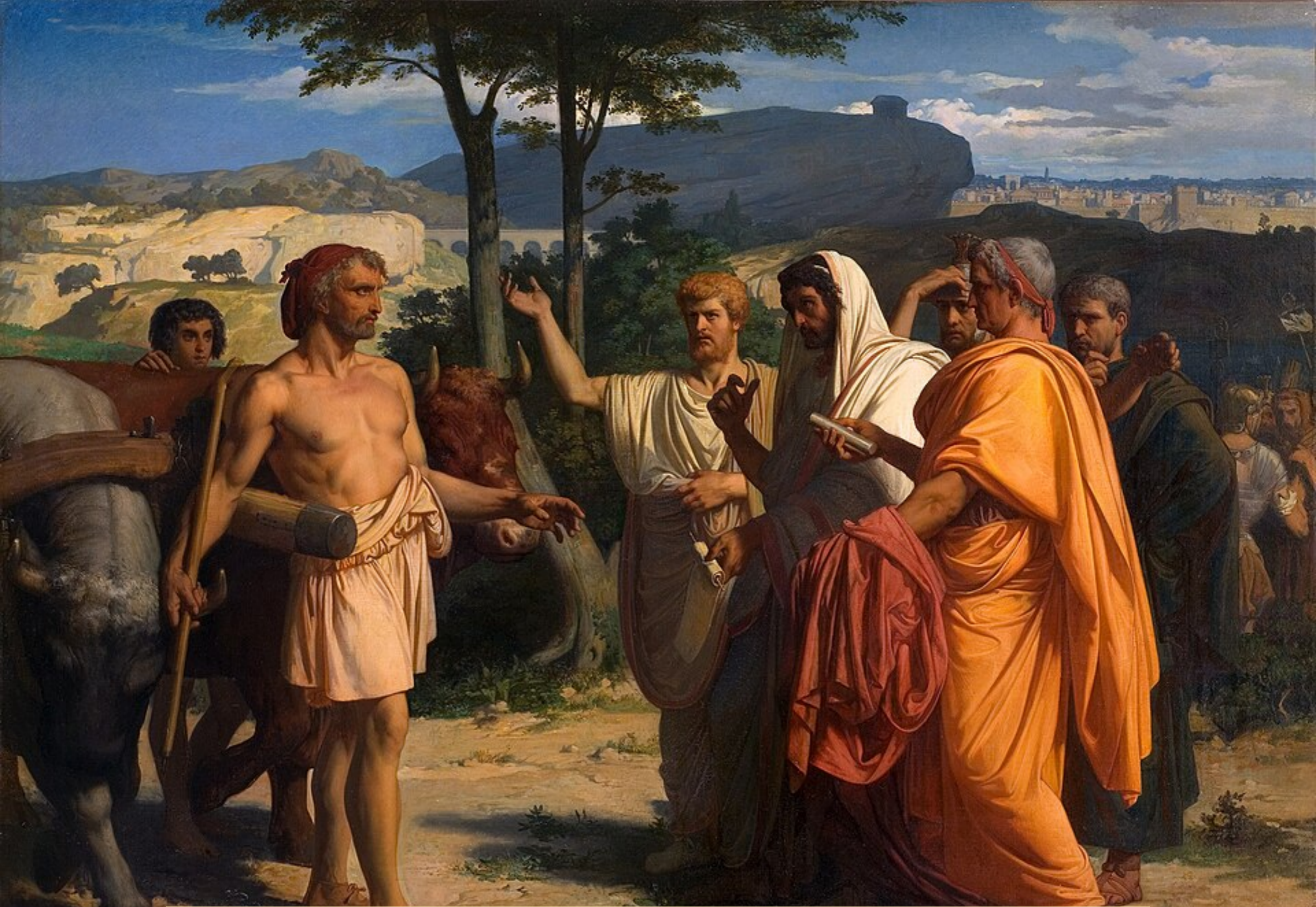
1843 Cincinnatus recevant les envoyés du Sénat